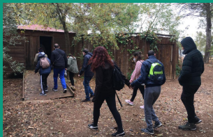
Zona de fauna irrecuperable