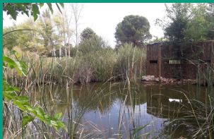
Zona senda botánica y humedal