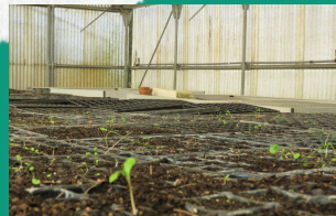
Zona vivero educación ambiental