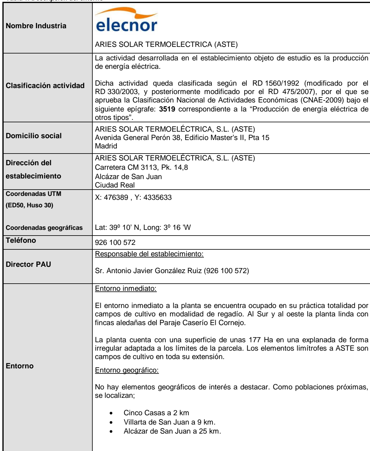
Tabla 1. Descripción del entorno