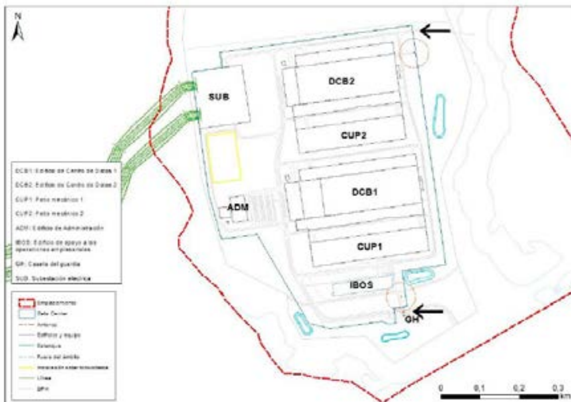
Distribución de las instalaciones del Data Center Campus.