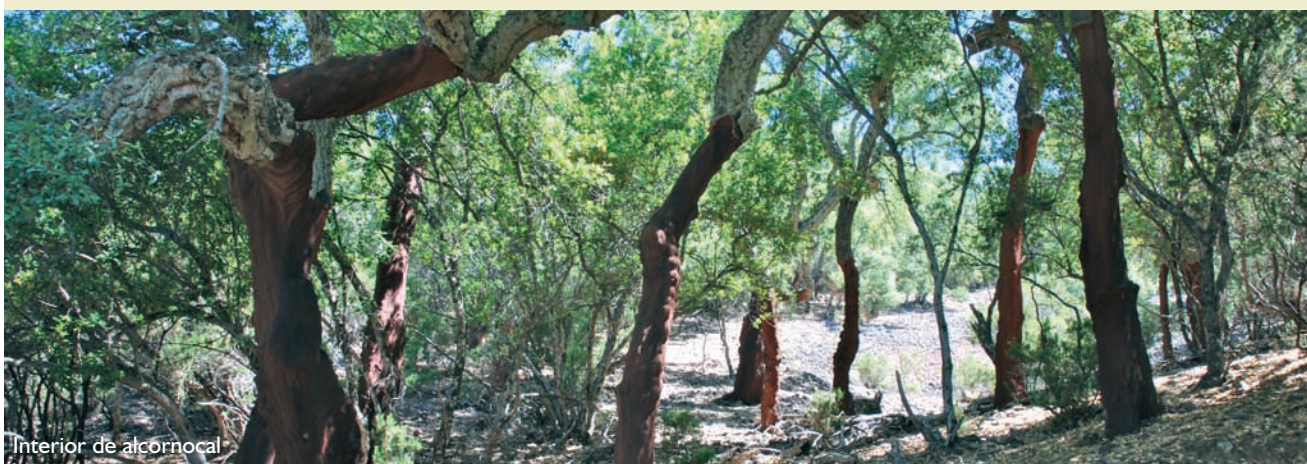
Interior de alcornocal

Época aconsejable de visita y otras recomendaciones: LIC de propiedad privada prácticamente en su totalidad. Las mejores épocas de visita son primavera, finales de otoño e invierno.