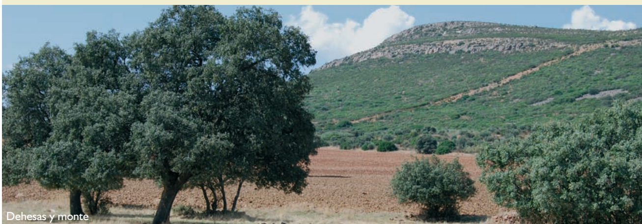
Dehesas y monte

Época aconsejable de visita y otras recomendaciones: primavera y otoño.